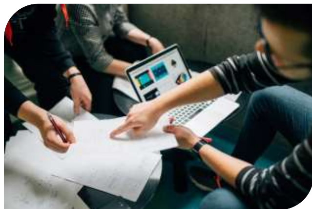
Uutta osaamista hankkivat työntekijät ja yrittäjät