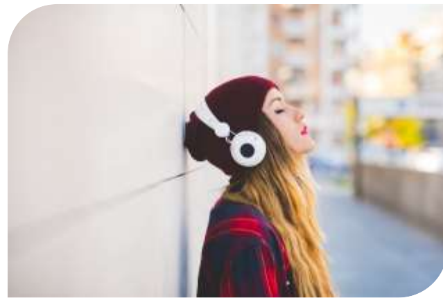
Vailla perusasteen jälkeistä tutkintoa olevat