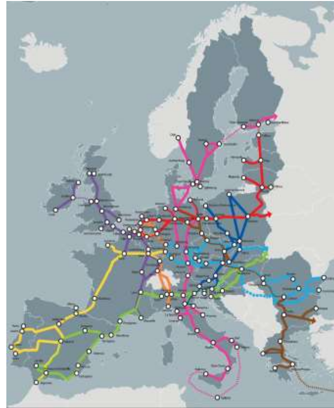
EU-rahoitusta saavat ydinkäytävät 2014-2020