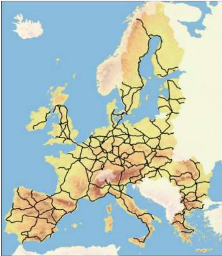
Eurooppalainen ydinverkko nyt Uusitaan 2023